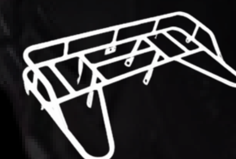
PARRILLAS DE CARGA FRON/TRAS