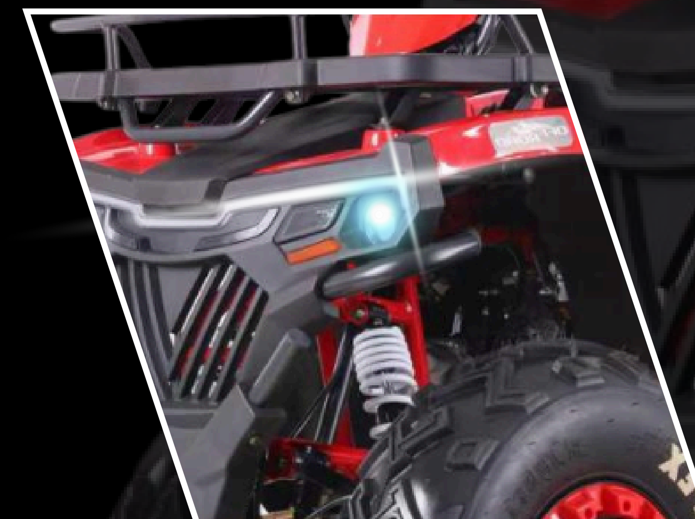
LED Light ILUMINACION HYPER LED