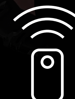
CONTROL REMOTO ENCENDIDO A DISTANCIA ALARMA DE SEGURIDAD