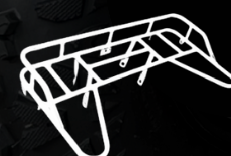
PARRILLAS DEL/TRA DE CARGA